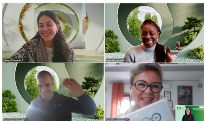
Parceiros do projeto durante a 2.ª reunião transnacional ONLINE, 16 de novembro de 2023

Para saber mais, siga o projeto nas redes sociais: