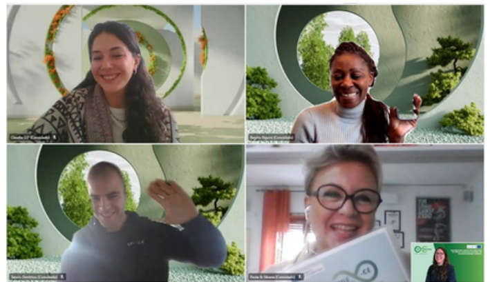
Socios del proyecto durante la 2ª reunión transnacional en línea, 16 de noviembre de 2023

El proyecto ha entrado en el mes 11 y los socios se reunieron para planificar los dos principales resultados importantes del proyecto, aparte de la donación de ordenadores portátiles. La reunión versó sobre la preparación de los módulos de los dos cursos de formación que se impartirán a los beneficiarios del proyecto.